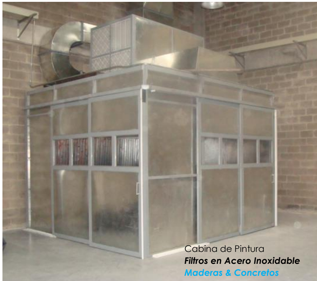
Cabina de Pintura Filtros en Acero Inoxidable Maderas & Concretos

Las cabinas de pintura fabricadas por HRG INGENIERIA tienen un diseño que ahorra espacio y propicia un trabajo más limpio para el operador y la pieza.