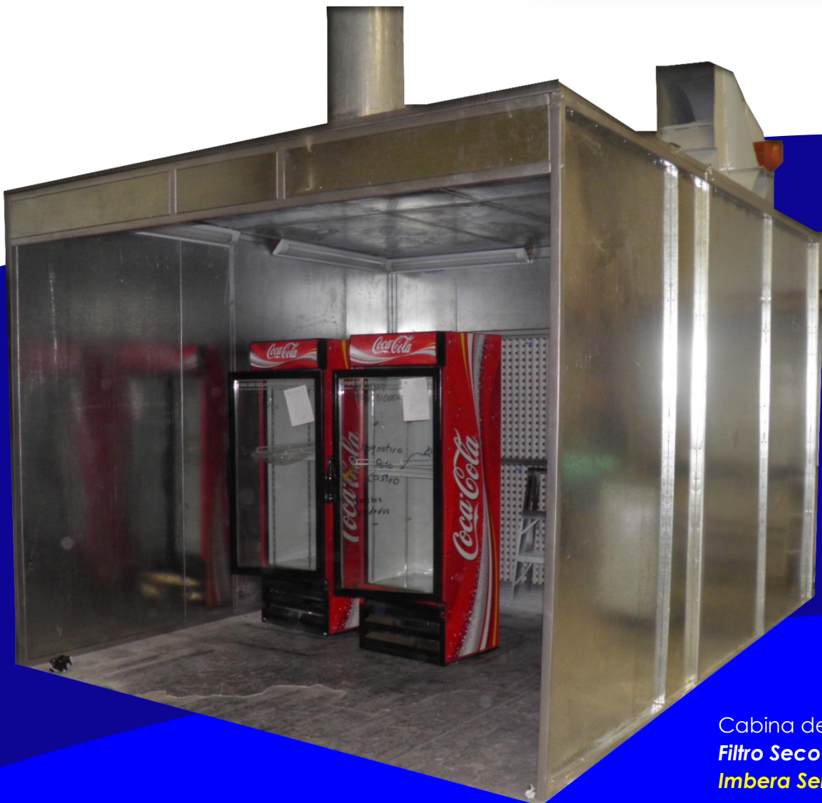
Cabina de Pintura Filtro Seco Imbera Servicios