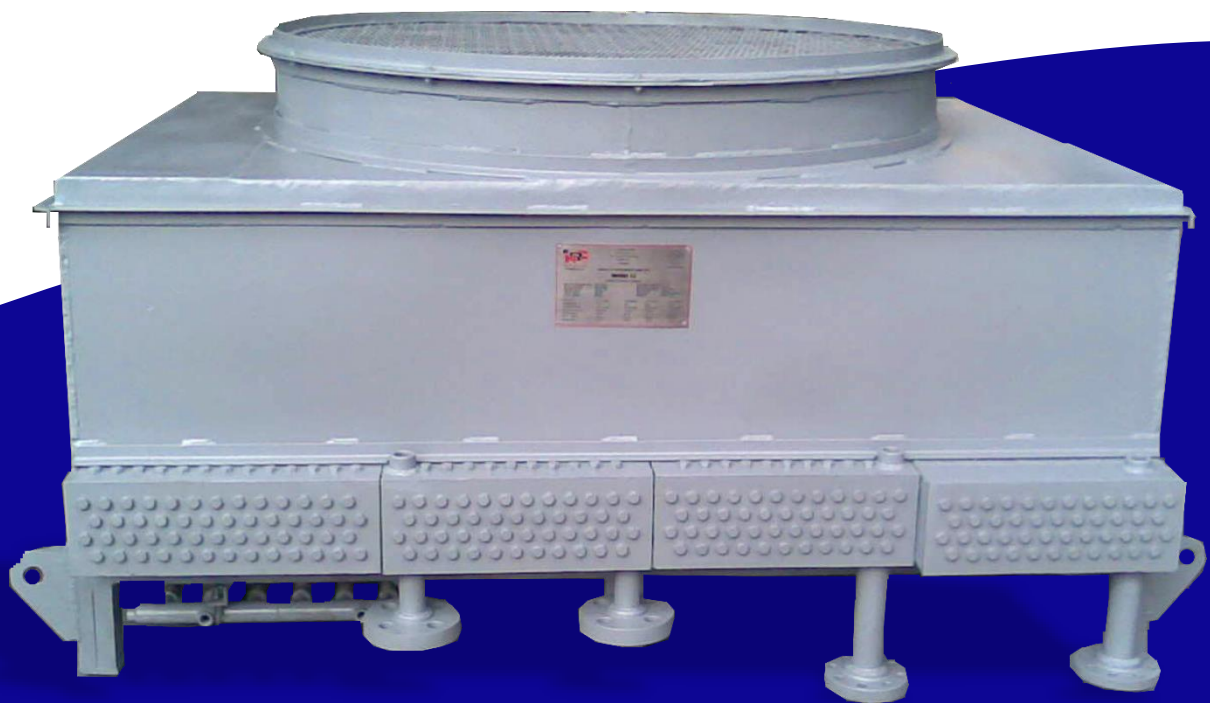
Enfriador de Gas-Aire AirCooler Gas-Air 6000 Psi